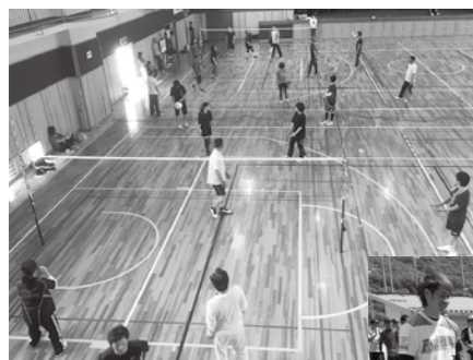
←《篠山体振》 6月 ソフトバレー大会

市内に6つある各体育振興会では、5月～8月にかけて体育祭の他に、ソフトバレー、グラウンドゴルフ、ファミリーバトミントンなど、各地区ごとにさまざまなスポーツ大会を開催し、老若男女、地域の人が交流を深めました。