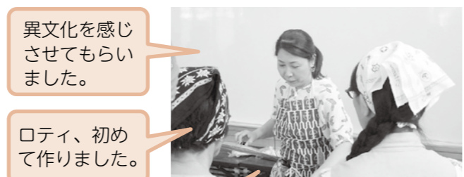
異文化を感じさせてもらいました。

郷土味学講座は、篠山の食材を使い、世界中の料理に挑戦し、新しい食文化を創造するコースです。新しい味覚が発見できます。