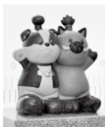
↑犬山市役所前に建てられているモニュメント。わん丸君とまるいの君