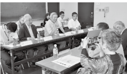
28年度の交流の様子。犬山城も見学しました。