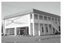
↑ 中央公民館分館（城東公民館）