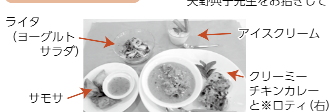
ライター (ヨーグルト サラダ)