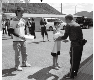
《今山体振》 5月 春季球技大会 (ソフトボール表彰)