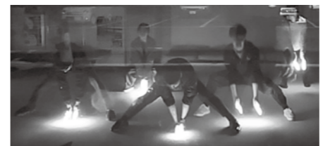
仕事の後、寒い中ダンスの練習を重ねました。