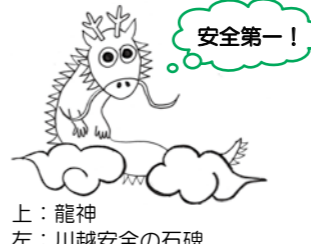
上：龍神 左：川越安全の石碑

むかし、篠山川にある大山の一の瀬や岡屋の渡り瀬、野間の弁天が湊などは、橋がないうに流れが速く、多くの旅人や地元の人々が犠牲になったことから「丹波の人取り川」と恐れられていたそうです。