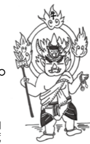
※左：牛頭天王の掛け軸 波々伯部神社所蔵