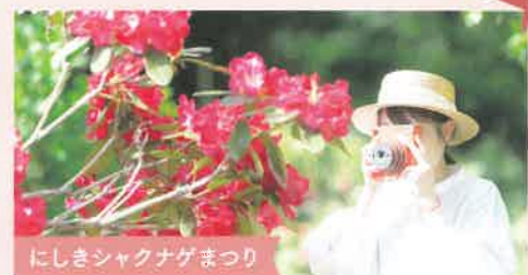
にしきシャクナゲまつり

旧西紀町の町花であり、「高嶺の花」という言葉の由来とも言われています。思わず目が留まるほど美しいこのシャクナゲが咲き誇る4月に、花とともに様々なイベントが開催されるイベントです。