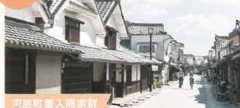
河原町妻入商家群

間口が狭く奥行きが深い造りをした、妻入りの商家が並ぶエリア。約600mにわたり、藩政時代の面影を色濃く残しています。グルメやお土産など、堪能しながら街歩きが楽しめます。