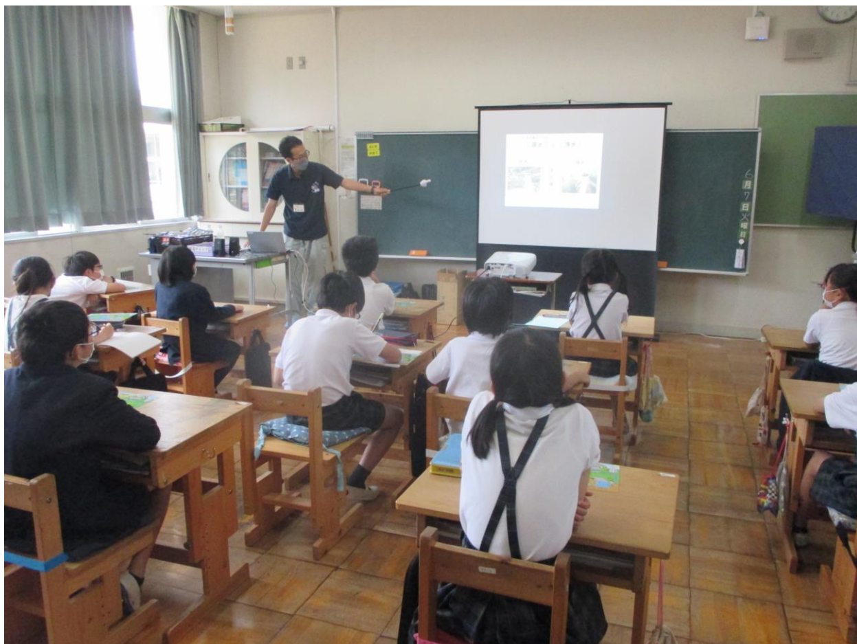
丹波篠山市の水道について出前授業の様子