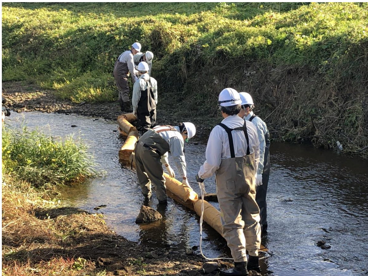
丹波市・丹波篠山市水道施設合同危機管理対応訓練でのオイルフェンス設置訓練の様子