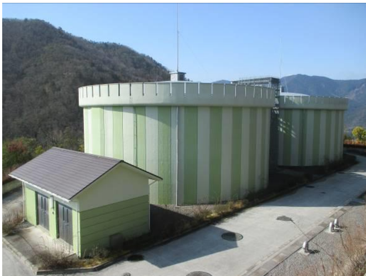
油井調整池兼配水池