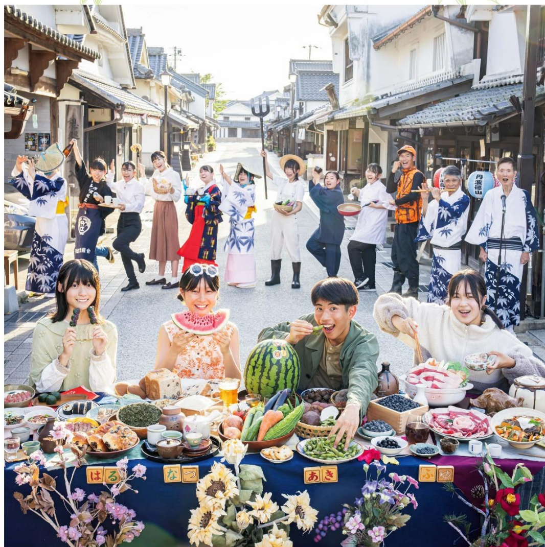
企画：篠山観光協会、タムサン市振興会 協力：丹波篠山市内各事業者、下町友好会