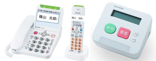
（自動録音電話機）（外付け録音機）