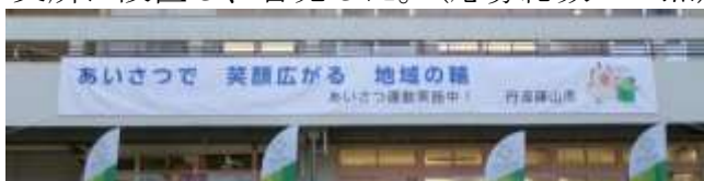
多紀支所・横断幕 最優秀賞作品

第22回人権フェスタメインイベント（12月14日）において優秀作品の表彰を行った。また優秀作品を掲載した懸垂幕・横断幕を作成し、市役所・各支所に設置し、啓発した。（応募総数23点）