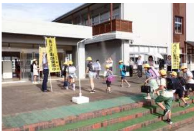
大山小学校でのあいさつ運動

毎月1日、11日、21日に市職員が「啓発のぼり」を持ち、商業施設、各小中および特別支援学校に出向いて街頭啓発活動に取り組む。