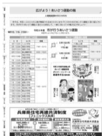
広報丹波篠山4月号