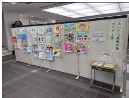
令和6年度あいさつ運動啓発ポスター展(市役所市民ホール)