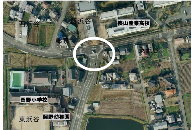
②岡野小学校北交差点