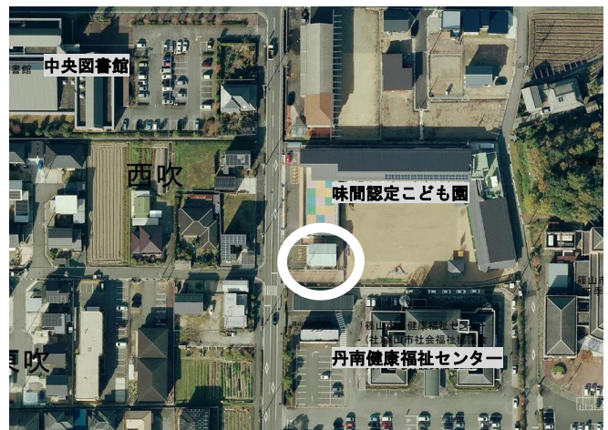
⑤味間認定こども園前