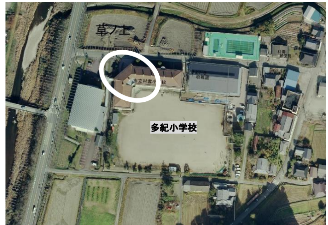
④多紀小学校正門前