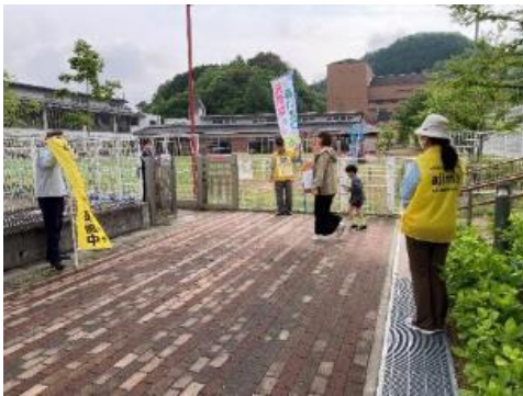
味間認定こども園