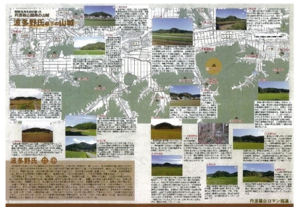
写真 9-4 丹波篠山ロマン街道 戦国乱世の道マップ