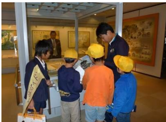
写真 9-2 丹波篠山お城子どもガイド