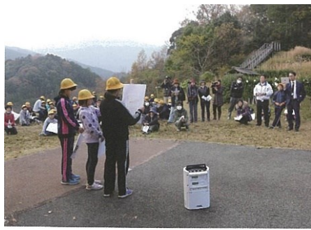
子どもガイドの実施(史跡河後森城跡)