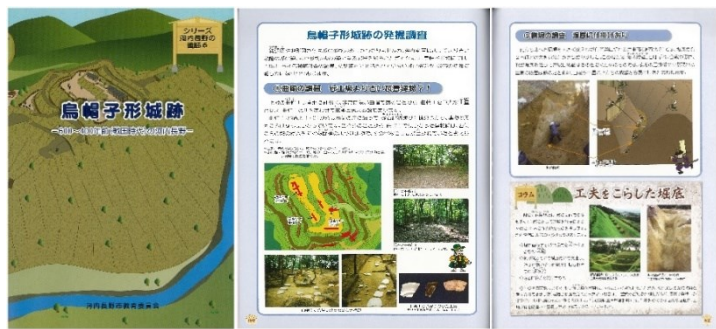
子ども向けの読本(史跡烏帽子形城跡)