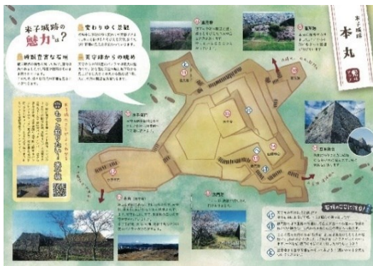
米子城跡ガイドブック(史跡米子城跡)