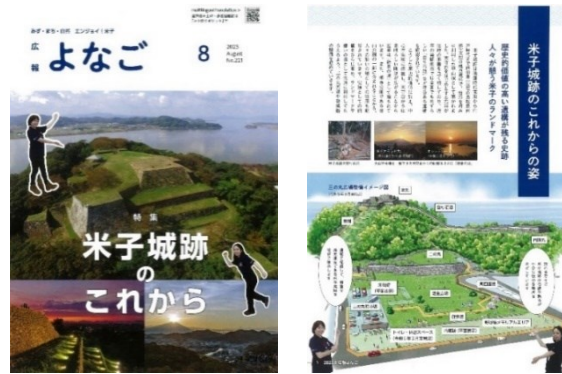
米子城跡の紹介「広報よなご(2023. 8月)」