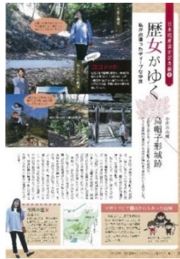
烏帽子形城跡の紹介 「広報かわちながの(2021. 4月)」