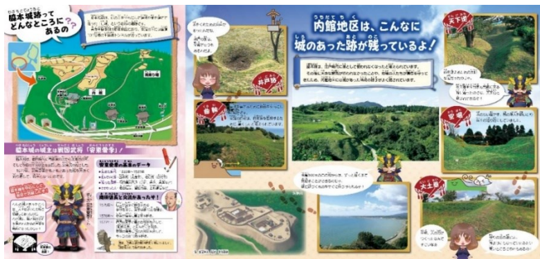
子ども向けパンフレットの参考例(史跡脇本城跡)