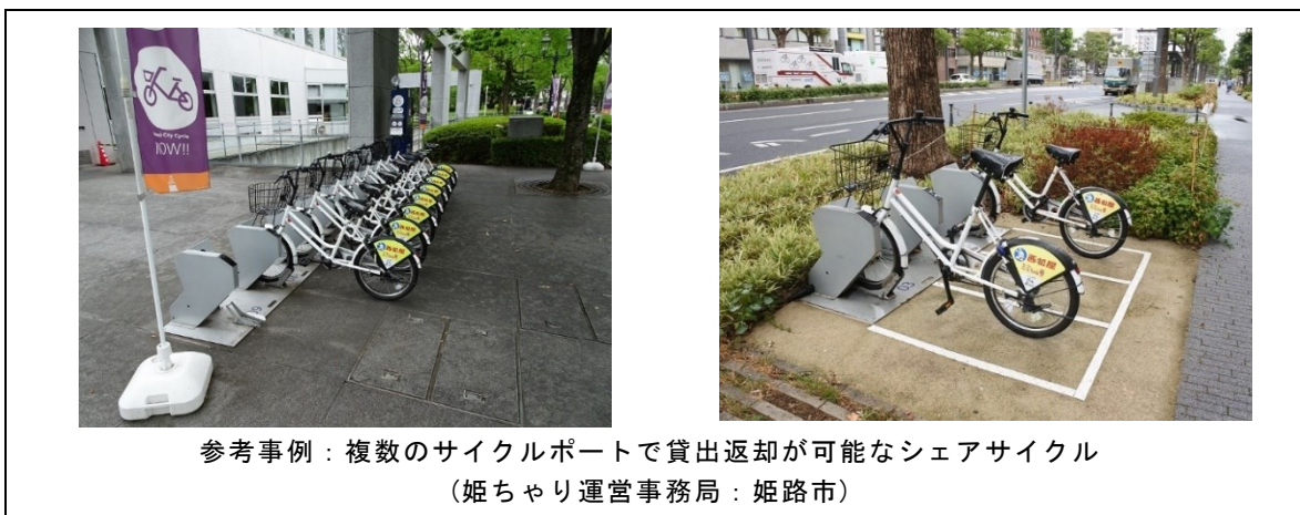
参考事例：複数のサイクルポートで貸出返却が可能なシェアサイクル (姫ちやり運営事務局：姫路市)