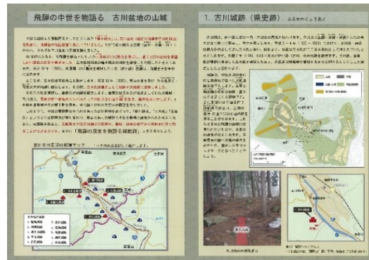
飛騨市山城マップ