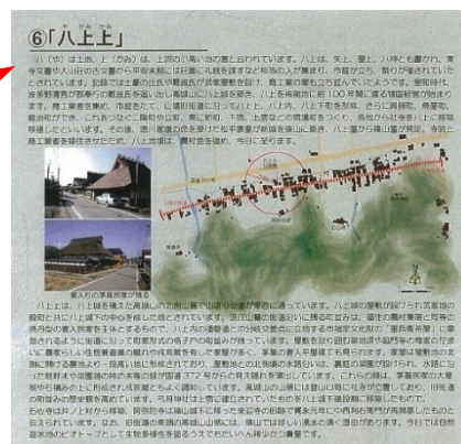
写真 9-5 丹波篠山口マン街道 町並み風景街道マップ