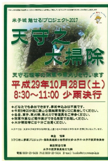
イベントや維持管理募集の案内(史跡米子城跡)