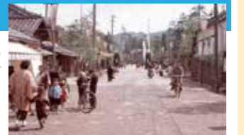
昭和30年代頃の大手通り北側からの写真

懐かしのメロディに、あの頃の思い出がよみがえる！ 予定曲=時代、真赤な太陽、青い山脈、学生時代 他