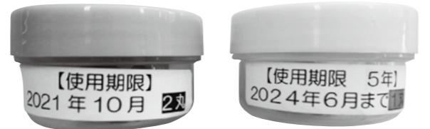
【使用期限】が「2024年6月」のもの、または使用期限が切れているものが交換対象