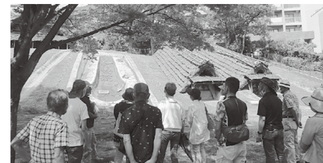
令和5年度の様子(現地学習)