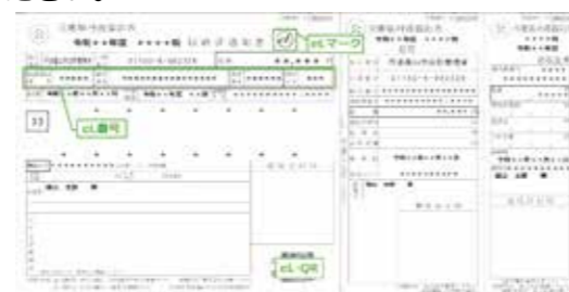
※「QRコード」は(株)デンソーウェブの登録商標です。

固定資産税と軽自動車税(種別割)に加え、4月から市県民税(普通徴収)と国民健康保険税もeL-QR(地方税統一QRコード)を利用した納付が可能となります。 全国の金融機関や地方税共同機構のサイトからクレジットカード(別途手数料が必要)での納付などが可能となります。 詳しくは「税金の納付 丹波篠山市」と検索し、ご確認ください。