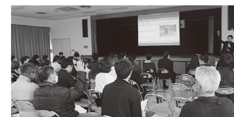
報告者と聴講者の間で活発な意見交換が見られました！

研究発表会の最後には、参加者による交流会が行われ、丹波篠山で活動・研究する人たちの交流でとても盛り上がりしました。今年度も、丹波篠山での研究や活動が期待できます！