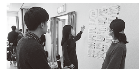
ポスターの前で学生が、質問に対して丁寧に説明を行いました