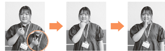
右手の親指と人さし指をばじく 右手4本の指の背をあごに当てる 右手を前に出しながら頭を下げる