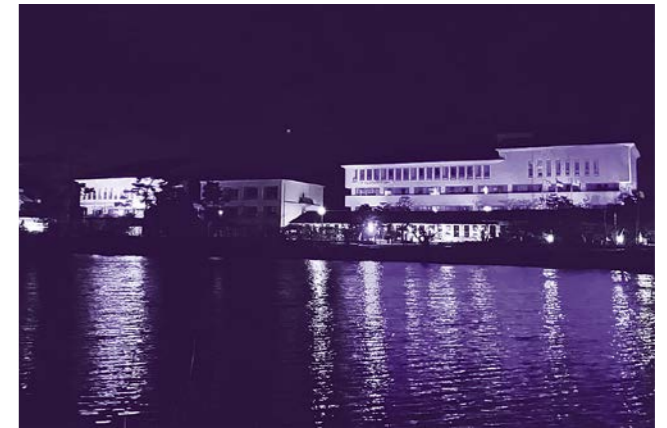
(令和5年11月撮影 市役所ライトアップの様子)