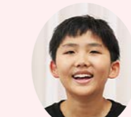
篠山養護学校 小学部5年生