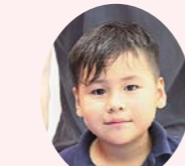
篠山養護学校 小学部1年生