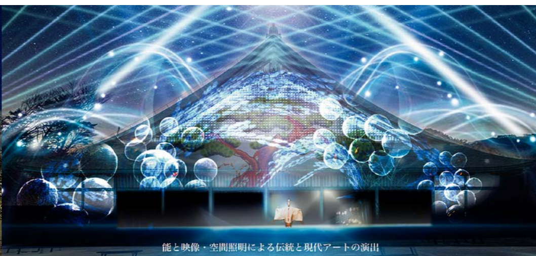
能と映像・空間照明による伝統と現代アートの演出