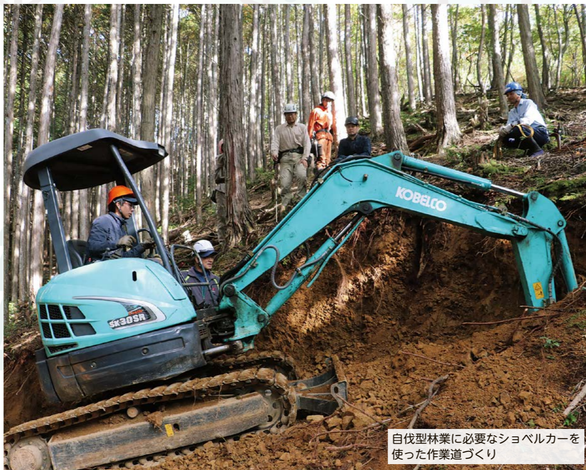
自伐型林業に必要なショベルカーを使った作業道づくり

近年、林業の担い手不足が課題となる中、少ない人数で比較的簡単な装備で林業ができ、副業など幅広い働き方も可能となり、新規参入がしやすいなどとして注目されている「自伐型林業」。本市では、丹波篠山市森林組合など林業事業者による森林管理に加え、個人でも新たに林業に取り組みやすく、環境に配慮した自伐型林業の手法を環境創造型林業として推進してまいります。 今回は、自伐型林業の特徴や市が行おうとする取り組みなどを紹介します。 問い合わせ 森づくり課 ☎552・1117