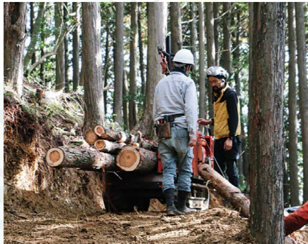
作業道を使った間伐材の搬出