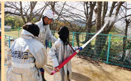
小学校での消火体験