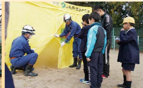
小学校での煙体験

地域をつなぐ消防団 何よりも、地域のコミュニティを大事にしたいです。住民の命を守ることを最優先としながら、普段の生活の中で、住民や団員と顔を合わせ、心を合わせ、コミュニティの輪を高めることで、防災に役立てていきたいと思っています。団員それぞれが地域を思い、仲間意識を持ち続ける消防団でありたいです。