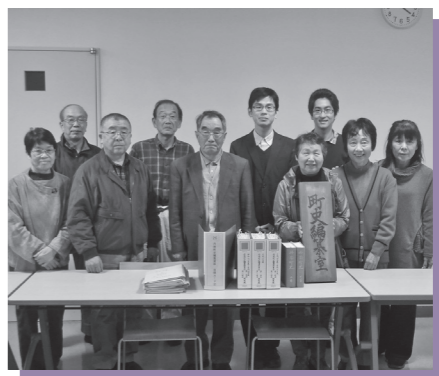
▲丹南町史編さん担当者、サポーターの皆さんと