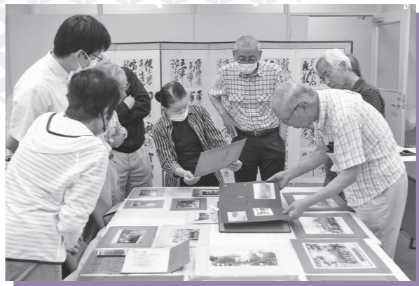
▲サポーター活動風景

丹波篠山地域は古くから郷土史研究が盛んだった地域ということもあり、地域の歴史や文化に深い造詣を持ち、主体的な調査に基づく知見をさまざまな形で発信している市民の方が多いと思います。市史編さん事業には年限がありますが、歴史文化を継承していく営みには終わりはありません。丹波篠山市史を編む過程に、大学などの研究者だけではなく、多くの市民の皆さんに積極的な形で関わっていただくことができれば、市史はおのずと多くの人が「読んでみたい」と思えるものになり、歴史文化を次世代へ伝えていく原動力となることでしょう。