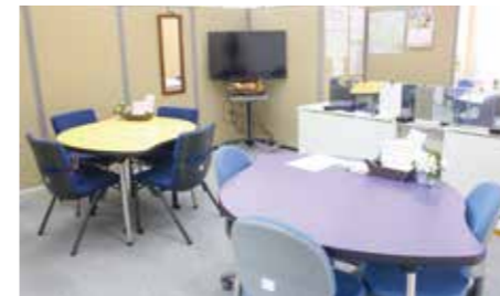
【結婚相談室 輪～りんぐ～】