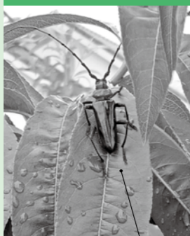
黒い体に赤い首 体長2.5~4cm