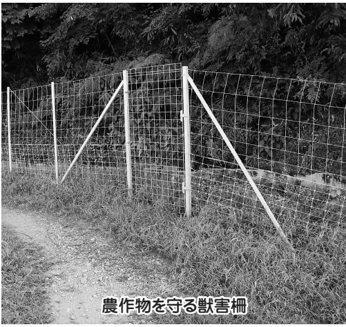
農作物を守る獣害柵

答2 シカについては、兵庫県の保護管理計画で3万5000頭の捕獲目標頭数が設定されており、その中で篠山市においては、1317頭が最低捕獲頭数と設定されている。イノシシにおいては、捕獲目標頭数の設定はない。