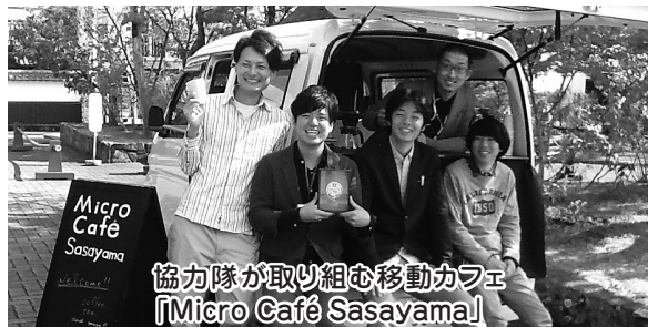
協力隊が取り組む移動カフェ「Micro Café Sasayama」

問1 3年後に定住を目標としている4人の協力隊員の将来を明るくするために、生業や収入について、地域住民と共に考え、市としてアドバイスや支援を行っていくことが必要ではないか。 答1 地域おこしのような活動は、長い目で見ていく必要がある中、活動支援としては、自動車の貸与や住宅改修等への支援、資格取得や視察等への助成を行っている。また、起業や生業を見越した指導を行うために大学へ委託し、専門の研究員を篠山フィールドステーションに配置いただいている。最終的には協力隊員が篠山の地に定住し、生業として起業していただくことが理想と考えている。 問2 地域活性化を進めていく上で、自然環境に恵まれた地域に住みたいと考える起業家や芸術家