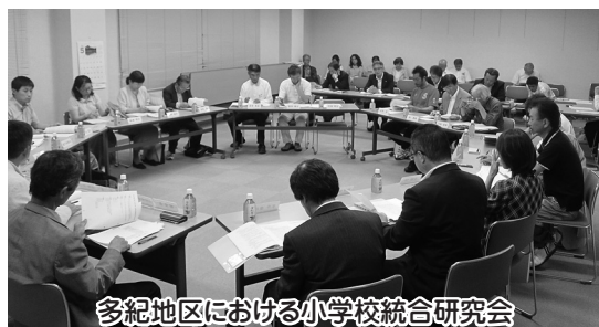
多紀地区における小学校統廃合研究会

問 多紀地区の福住、村雲、大芋3小学校の統合については、統合研究会において、統合を「可」とする決定が出されたところであるが、統廃合は地域づくりに大きく影響する。「統合の目的の第一は何か」、「統合の必要性の議論はつくされたのか」、「さらに統廃合を進めようとする文部科学省の方針に対する見解は」、「統合後の地域づくりのビジョンはどうか」等について見解を問う。 答 平成22年10月の篠山市小中学校適正配置等審議会最終答申「篠山市教育改革5カ年・10カ年実施計画」により取り組んでいる。「地域や保護者の考えが反映されない教育環境であってはならない。また地域や保護者のために子どもの教育環境が損なわれてはならない」という考えから、教育委員会や学校、保護者、