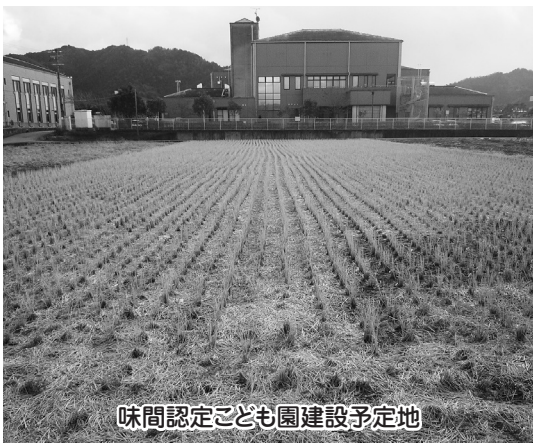
味間認定こども園建設予定地

子どもたちや保護者が望む施設であり、平成28年度当初の開園が遅れることは、許されるものではない。用地契約についても、市が地権者にお願したものであり、売買契約の解約に係る解除金の負担は適当と考える。また、本提案の用地は、市が示した8案のうち整備検討委員会で最も適地であると認定されており、保育環境や安全面を考慮すると最適地であると考えられる。将来に採めないためにも、議員全員が賛同して事業を進めるべきである。