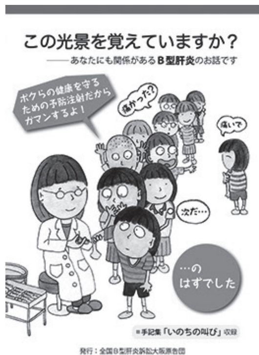
全国B型肝炎訴訟大阪原告団が作成している手記集