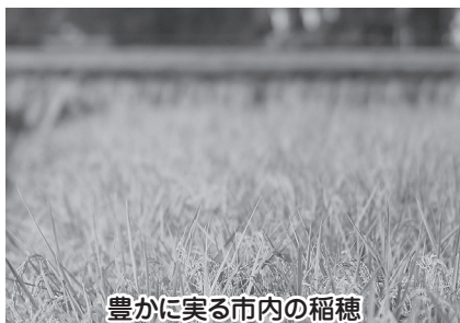
豊かに実る市内の稲穂

問1 日本国民のお米の消費量は減少を続け、生産調整を行っても米あまりの状況である。それに伴い米価は下落を続け、本年は絶望的な価格となった。生産意欲を失いつつある市内農家や農村社会を守るため「市民に篠山産のお米を食べてもらおう運動」を展開してはどうか。 答1 米の販売環境が改善しないために、価格低下を余儀なくされている。水稻は水田の六割弱を占め、栽培意欲の減退は地域の農業に対する影響が大きい。篠山市農都創造条例において、地産地消を施策の一つとしており、「市民に篠山のお米を食べてもらおう運動」を、今後策定の計画に位置付けて実施していきたい。 問2 平成27年春に北堀にボートを浮かべる取組みが進められている。ボートを浮かべるだけでなく