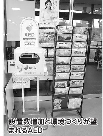
設置数増加と環境づくりが望まれるAED

取組みなども勘案し、検討していきたい。 問2 ①夜間、休日も関係なく起きる心臓発作。いつでもAEDを使える体制として、コンビニに設置の検討を。②24時間使用できる環境整備をどう進めていくのか。