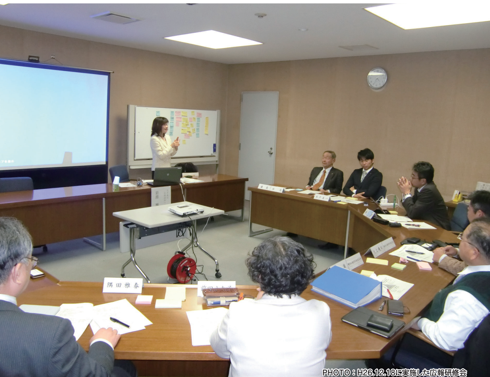
PHOTO : H26.12.18に実施した広報研修会