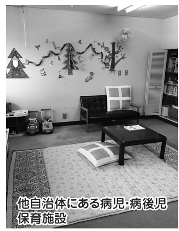
他自治体にある病児・病後児保育施設

病後児保育事業は実施していないが、医療機関や関係機関と連携・調整を図り、平成28年度からの開始に向けて取り組んでいく。