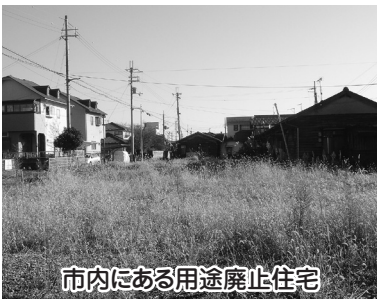
市内にある用途廃止住宅

答2 ①長年住み慣れた住宅や地域であること、経済的負担が大きくなること等により、入居継続を強く希望されている。今後も、移転の促進に向け働きかけを行っていきたいが、現時点では、目標年度の設定は行っていない。②現時点では具体的に検討していない。一団の更地になった場合に具体的な活用方針が必要になると考える。