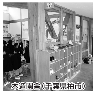
木造園舎(千葉県柏市)

答 ①木の柔らかさや温かさ、香りは、癒しや安らぎを与えらるとともに、室内の温度や湿度変化を緩和させて、快適性を高める効果もある。②安全性・機能性・品質等とともに、模倣性・偶然性・競争性等が必要であると考え。③色の効果として集中力や創造力、コミュニケーション力などを育てる「色育」がある。また、木目を見たり、木のおいしさを嗅ぐことによる、体のリラックス効果もある。