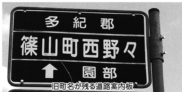
旧町名が残る道路案内板

問1 市内居住者や訪れる方々に優しく分かりやすい案内をするために、道路標識や観光案内板、伝統文化施設表示板等の点検を行い、整備し直す必要があるのではないか。 答1 標識及び観光案内板等の損傷状況や表示の修正が必要な標識、不要と思われる標識について調査し、対応していく。 問2 ①市の歌について、ふるさと教育の一環として覚え学ぶ機会を作る必要があるのではないか。②市の花「ささゆり」は絶滅の危機にあると言われる希少野生植物であり、絶やさないように増殖や普及活動を行う必要があるのではないか。 答2 ①さらなる普及浸透に向け、市民に知って、歌っていただけのように取り組んでいく。②生物多様性保全の取り組み推進策を検討しており、保全