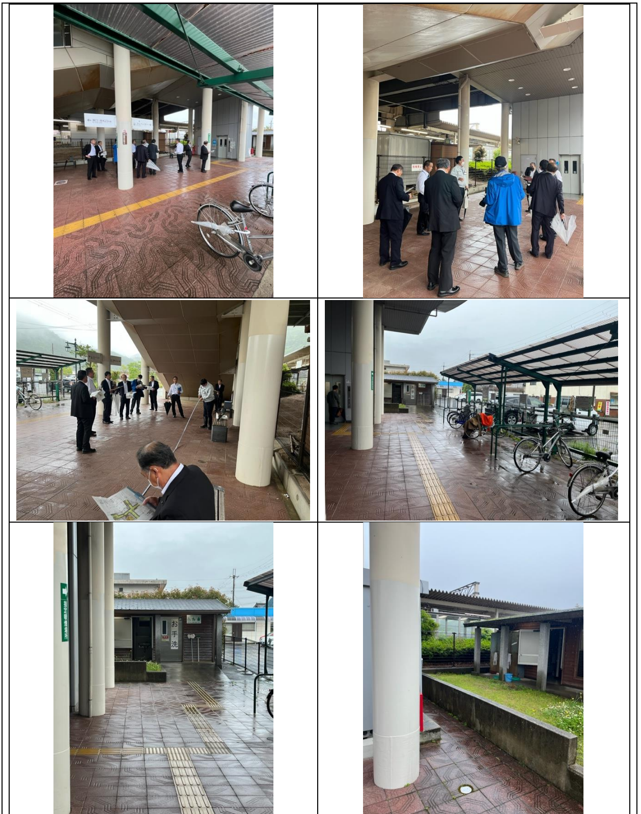
(現地確認の後、予算決算委員会産業建設分科会にて補正予算の審査を行った)