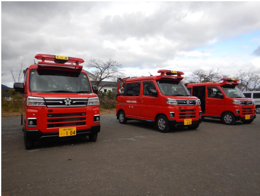
【参考写真】令和7年度に購入した同型車両

吸管、消火栓開閉金具、管鎗（筒先）、とび口、はしご、消火器、消防ホース、ホース背負器