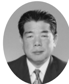
副議長 降矢太刀雄