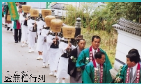
こむそう 虚無僧行列