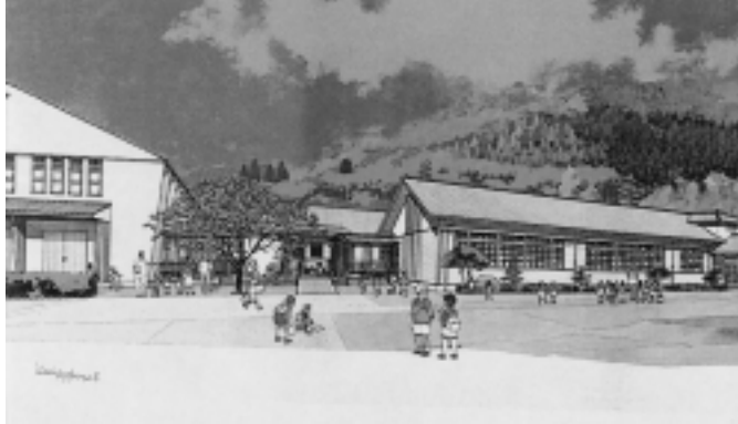
▲ チルドレンズミュージアム完成予想図