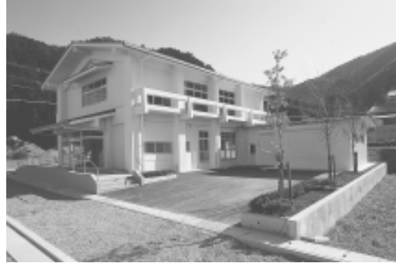
▲ 篠山駅西コミュニティ消防センター