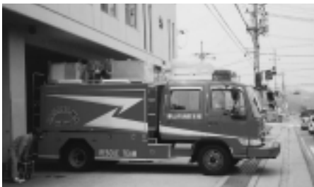
救助工作車の更新