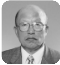
上月 格男 委員