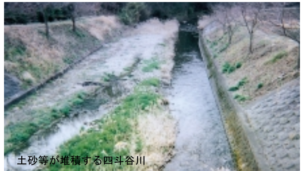
土砂等が堆積する四斗谷川

市道公園線の陶の郷橋付近から下流の井堰までの約二〇〇mの区間に土砂等が堆積し、平成八年の集中降雨時には護岸を溢水し、堤内の農地などに甚大な被害を及ぼしました。その後も堆積物が増え続けております。今後とも同じような被害を及ぼす危険が予想されますので流域住民の心情をご賢察賜りよろしくお願い申し上げます。