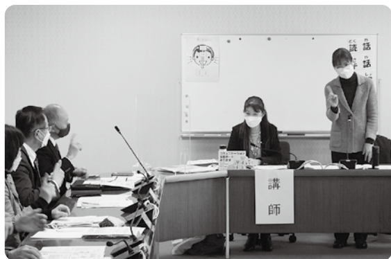
保健福祉部長らを講師に手話を学ぶ

議会としても手話が言語であることを認識し、手話の理解と普及に広く努めるため、市の職員を講師として招き、簡単な手話の実技研修を令和5年1月30日に開催しました。