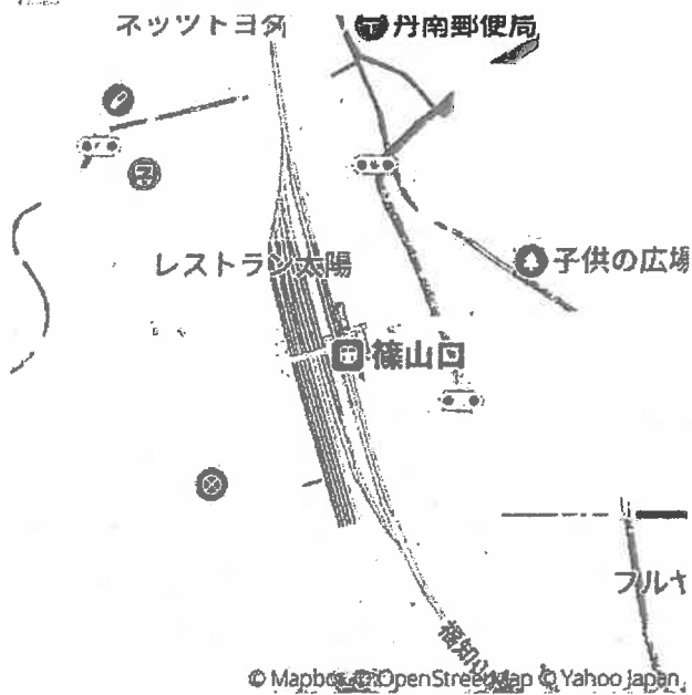
出発地の周辺地図