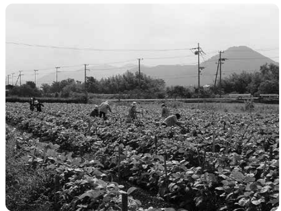
丹波黒枝豆の収穫