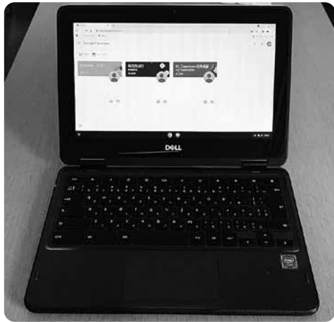
学校で使用しているノートパソコン(PC)

世帯所得に応じて、通信費を負担する自治体も多く、公平な学びの観点からルーター貸出希望世帯、もしくは低