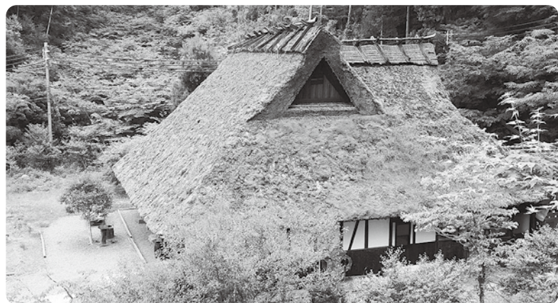
四季の森公園の長者屋敷