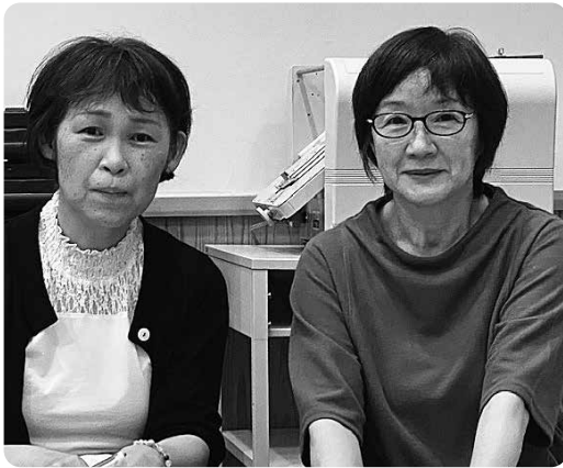
東岡屋の女性役員

市民に啓発するためには、市職員の取り組みが重要であり、副市長男女各一名制については、今後検討していきたい。