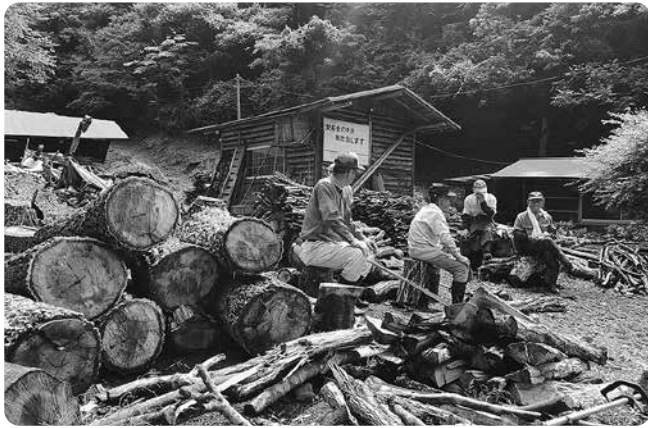
地域での炭・薪づくり

森林管理制度は条件整備が必要で、直ちに組み込みは難しいと考えるが、「森林経営明確化促進事業」を活用し、森林境界の把握や、将来的には航空機等を活用した立木情報の取得を検討