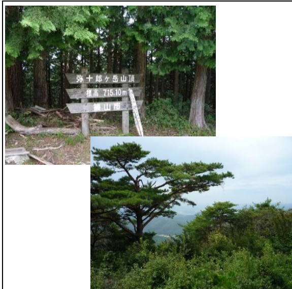
頂上の看板と展望