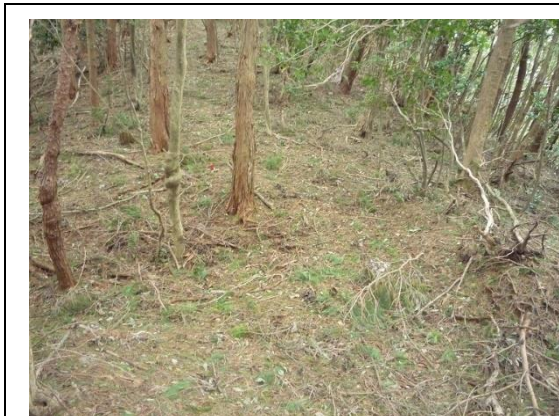
籠坊温泉と後川登山口への分岐