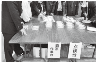
投票用紙を開票・集計中！