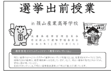
充実した講義内容でした！