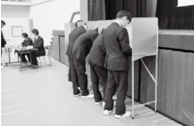
どの政党を選ぶか真剣に悩んでいます！