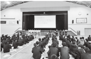
政党のマニフェストを発表！