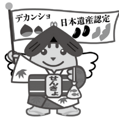
丹波篠山市の 選挙啓発イメージキャラクター 「デカンショめいすいくん」です!

来る4月21日に丹波篠山市議会議員選挙が行われます。高齢者も若者も安心して暮らせるまちを実現してくれる人を選ぶために「大切な一票」を放棄せずに投票に行きましょう。そして、その「大切な一票」で丹波篠山をさらに魅力のあるまちにしていきたいと思います!!