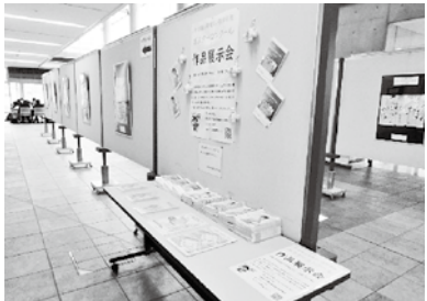
展示会場（市民センター）の風景です