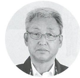
河南 寛 (味間) 東古佐202-3 ☎594-1688