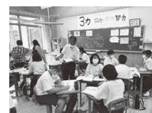
道徳の授業における集団思考(篠山東中)

道徳科における指導の充実を図り、児童生徒の社会性や規範意識、思いやりの心などの育成及びふるさとへの誇りや愛着など「ふるさと意識」の醸成を図ります。また、発達段階に応じ、各教科等や体験活動との関連及び地域や家庭の実態を考慮した指導を行います。