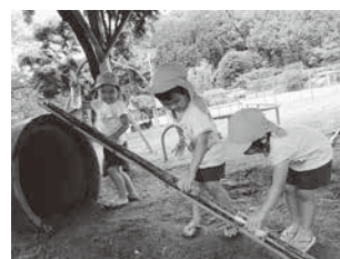
竹で水遊び(大山幼)

全ての保育園・幼稚園・こども園において、体幹づくりを意識した保育を実施し、動きやすい体・転びにくい体の形成を図ります。