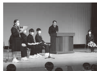
夢プランで発表する生徒たち

社会的・職業的に自立し、社会の中で自分の役割を果たしながら、自分らしい生き方を実現するための力を育むキャリア教育を教育活動全体を通して取り組みます。その実現に向けて保護者や地域の人々、関係機関等と連携して、自然体験や社会体験などの機会を設け、中学2年生とその保護者を対象に、自らの生き方や将来について考える事業「夢プラン」を実施するなどします。