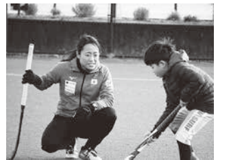
ライジングスター育成事業

安全安心で魅力ある大会となるよう関係機関との連携を図るとともに、市民ボランティアスタッフを広く呼びかけ、市民参画による大会運営を通して、活力あるまちづくりを進めます。