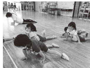
体幹づくり体操(八上幼)

丹波篠山ならではの自然を最大限に生かせるような保育・教育環境を整えます。また、高い自己肯定感を持ち、他者を大切にできる園児を育てるために、職員の研修充実を図り、資質向上に努めます。