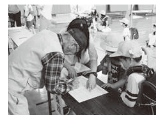
引き渡し訓練(西紀北小)

「GIGAスクール構想の実現」を踏まえ、その着実な実施に向けて、児童生徒一人一台パソコンの環境におけるICTの効果的な活用を一層推進します。