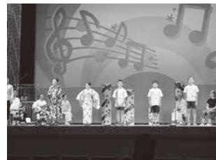
デカンショのど自慢大会 への出場(篠山小)