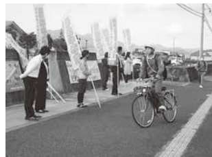
保護者と教職員による あいさつ運動(篠山中)

学校・家庭・地域が連携した啓発・実践活動に継続して取り組み、日頃からあいさつが交わせる、明るく温かいまちづくり、学校づくりをめざします。