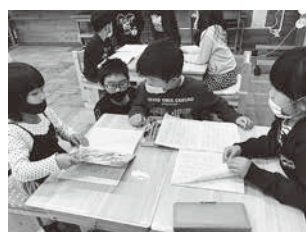
異学年でノートの取り方を交流(大山小)

主体的な学習習慣の育成を目指して、全学校で、家庭と連携した取組の工夫・改善を図り、朝学習、放課後学習等を充実します。また、児童生徒が、一人一台パソコンの学習環境や、学習プリント配信システム、タブレットドリル等を活用し、「自ら学ぶ」学習に取り組める環境整備を行います。