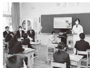
食育授業風景(多紀小)

学校給食センターと学校・家庭・地域とが連携して食育の推進に取り組みます。全国学校給食甲子園での献立部門2年連続入賞は、農都・丹波篠山を全国にアピールすることができました。これからも日本一の給食献立を維持できるよう努めるとともに、学校給食レシピ本を刊行し、地元特産物とともにアピールしていきます。