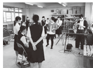
部活動指導員による指導 (丹南中)