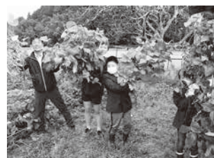
特別支援学級での黒豆づくり (城南小)

障がいのある子どもたちに対して合理的配慮を適切に提供します。そのために必要となる教職員等を対象とした研修会の実施及び基礎的環境整備について推進します。