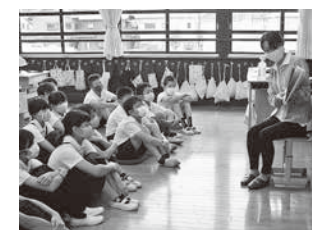
読み聞かせ会(八上小)