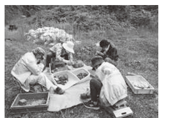
市民ボランティアによる岩石調査(宮田重点保護区域)

丹波地域恐竜化石フィールドミュージアム構想に基づき、化石発掘体験イベントや全小学校を対象とした校外学習プログラムを実施し、篠山層群及び脊椎動物化石の保護・活用を推進します。また、宮田の重点保護区域において調査を行い、市民を対象に体験学習の場として活用を推進します。