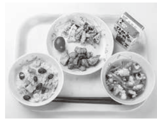
全国学校給食甲子園入賞献立

地元で生産された安全・安心な丹波篠山産コシヒカリを100%使用し、地元の野菜を積極的に活用することで、食材への慈しみや生産者への感謝の気持ち、ふるさとを愛し誇りに思う心を育みます。