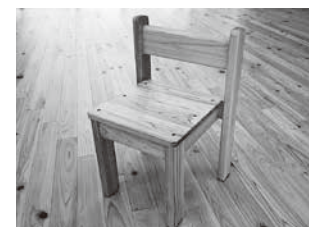
市内産木材の園児椅子