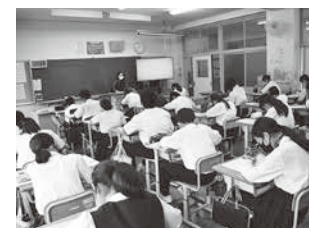
スクールカウンセラーによる 道徳授業(今田中)

いじめは、「どの子どもにも、どの学校にも起こり得る」ことを踏まえ、学校、家庭、地域が一体となって、未然防止・早期発見・早期対応に取り組みます。