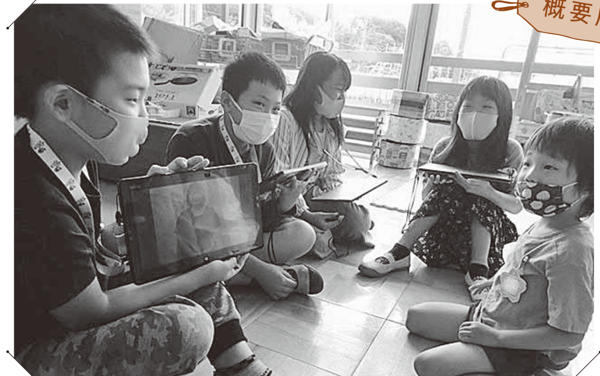
タブレットを使って幼稚園児に小学校を紹介(岡野小)