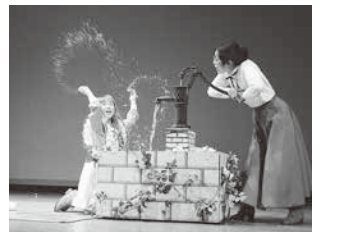
丹波篠山市民ミュージカル第9弾

文化施設4館(篠山城大書院、歴史美術館、青山歴史村、武家屋敷安間家史料館)において、丹波篠山の歴史文化の発信を継続します。