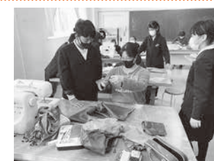
エコバッグづくり(古市小)

発達段階に応じて、地域の人材・施設を活用したり、自然や風土を活かした学習素材を活用したりし、直接体験を通して、地域の特性を踏まえた環境教育を推進します。