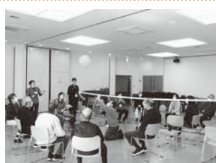
丹波くすの木学級 風船バレー体験

兵庫県が進める「くすの木学級(聴覚・言語障がい)」「青い鳥学級(視覚障がい)」は、障がい者が社会参加する貴重な機会となるため、継続的に事業運営を支援します。