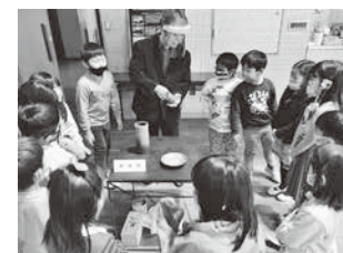
地域の方から日本六古窯を 学ぶ(今田小)

小学生から高校生までの児童生徒が公民館等で集団生活を送りながら通学し、もらい風呂や交流活動を取り入れる「通学合宿」、また、小学生が主体的に地域で実施される行事や奉仕活動、学習活動等に参加する「トライしようDAY」など、地域の教育力を活かした事業を進めます。