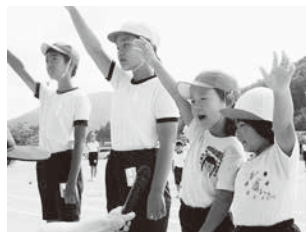
幼小合同運動会(古市小・幼)

幼児期の教育と小学校教育の円滑な接続をめざし、地域や各園の実情に応じたアプローチカリキュラムを活用した、幼稚園・こども園、小学校の連携充実を図ります。また、私立園も含め、保育園・幼稚園・こども園の指導方法等について連携を強化します。