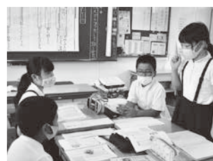
グループ内での意見交流を通して学びを深める(城北畑小)