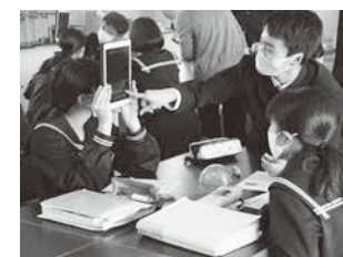
星座アプリを活用し、星の動きを確認(西紀中)

外国語指導助手(ALT)や小学校外国語学習指導補助員(JTE)との外国語を用いたふれあいや対話を通して、主体的に外国語を用いてコミュニケーションを図ろうとする態度を育成します。長期休業中には小学生を対象としたイングリッシュ・デイ・キャンプ等を実施し、児童が様々な活動を通してALTや市内小学校からの参加児童と英語を使って交流することにより、コミュニケーション能力の向上を図ります。