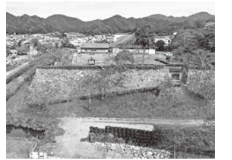
修理を進めている二の丸南西の高石垣(篠山城跡)

「歴史文化まちづくり資産」を総合的に保存・活用するため、「文化財保存活用地域計画」を国へ認定申請し、計画に基づいた歴史文化を活かした地域づくりを推進します。