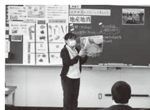
栄養教諭による授業(城東小)

部活動にかかる業務や生徒の心のケアを行い、充実した部活動を推進するために、令和3年度から「部活動推進員」を中学校に配置します。また、専門的な知識と技能を有し、スポーツ、音楽、美術等における活動の楽しさや段階的な指導ができる地域の指導者の「部活動支援員」、技術指導に加え試合や大会などを単独で引率できる「部活動指導員」も引き続き任用し、部活動の充実と教職員の負担軽減を図ります。