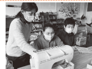
職場体験(篠山養護学校)

学校・家庭・地域の連携のもと、地域の中で行う社会体験活動を通して「生きる力」を身につける「トライやる・ウィーク」、中学生が様々な地域活動の体験を通して、地域の人々の温かさ、良さや伝統・文化等にふれるとともに、地域のつながりを深化させ、ふるさと意識の醸成を図る「トライやる」アクションに取り組みます。