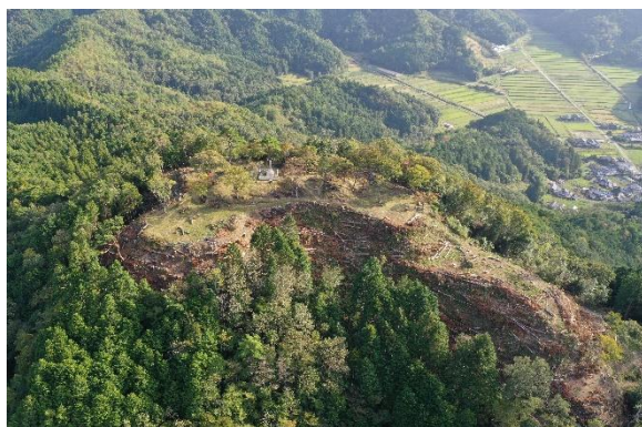
八上城跡空撮写真

※行政(文)は文化財課、行政(関)は関連部局。上段：主として取り組む主体、下段：協力して取り組む主体