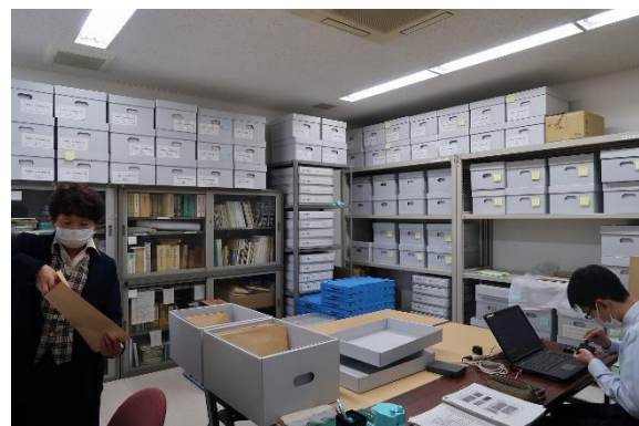
市史編纂資料の整理作業