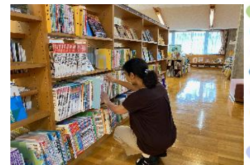
右の写真は、書架整理の様子

お問い合わせ先: 丹波篠山市民センター図書コーナー「本の郷」 丹波篠山市黒岡 191 番地(丹波篠山市立丹波篠山市民センター内) TEL.079-552-0394