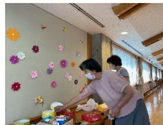
左の写真は、壁面の装飾の様子