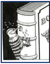
マークデザイン 加藤昌男