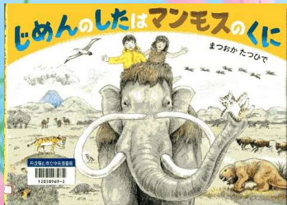
じめんのしたはマンモスのくに (E7) 童心社 まつおか たつひで 作・絵

<本屋 本の木>の看板ねこルビが、お気に入りの ペーカリー<小麦に吹く風>に本を届けに行く と、元気いっばいの千ピねこたちが現れた！ル ビは、お兄さんねこになれるかな？