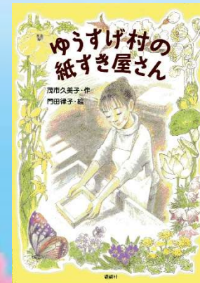
ゆうすげ村の紙すき屋さん (913E) 講談社 茂市 久美子 作

地面の下へもぐっていくと、そこは絶滅した生 き物のいる世界。マンモスに乗ったり、サーベル タイガーに襲われているオオナマケモノを石の やりで助けたい…。さあ、絶滅動物に出会える 大冒険にでかけよう！