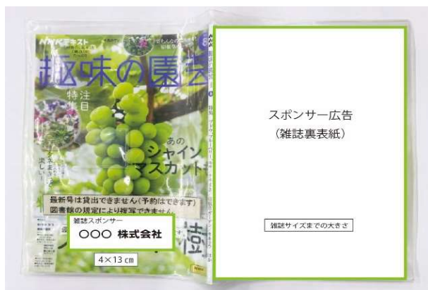
広告イメージ①(雑誌の表紙・裏表紙)