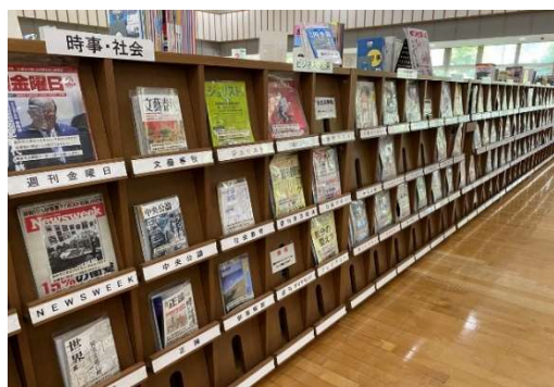
中央図書館 雑誌書架

雑誌コーナーは、中央図書館・市民C図書コーナー共に、来館者がゆっくりくつろげるブラウジングコーナー(閲覧コーナー)に設置しており、地元企業・団体の皆様の「PRの場」としてもご活用ください!