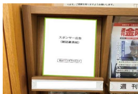
広告イメージ②(雑誌書架の蓋)