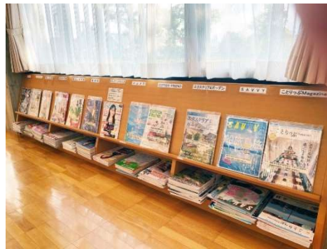
市民C図書コーナー 雑誌書架