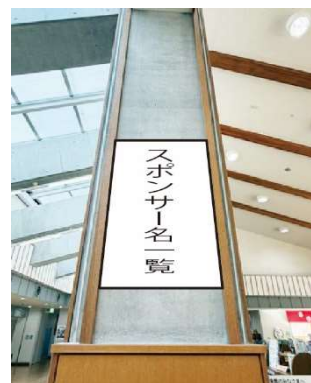
スポンサーボードの設置