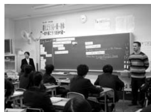
篠山中学校 ALT活用の英語の授業