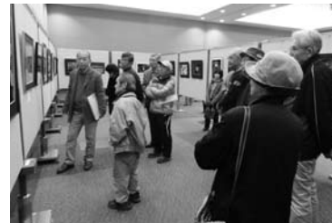
市展 写真部門講評

第10回記念として篠山市展を開催します。芸術文化を通して市内外の人との交流や情報交換の場を提供するとともに、篠山市の伝統文化の発信と篠山の芸術文化の更なる発展をめざします。