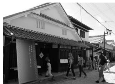
重要伝統的建造物群保存地区(河原町)

保存地区のまちづくりを保存地区住民と連携しながら進め、伝統的建造物(安間家史料館、篠山地区4件、福住地区4件)の保存修理を行います。選定10周年となる篠山城下町地区で記念シンポジウムを開催し、福住地区においては、保存地区の防災計画を策定します。