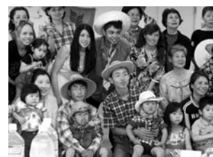
今田中学校 篠山市国際理解センターにて交流