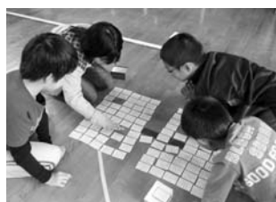
西紀小学校 西紀3小学校交流