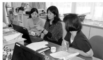
城東小学校 若手教職員の育成

様々な教育課題に適切に対応するため、教職員の資質の向上をめざした研修会などを実施するとともに、校内研修の充実や市内の研究指定校や先進校の公開授業等に積極的に参加することで、実践的な指導力を高め生きる力の育成や学力の向上に努めます。