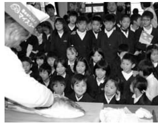
篠山小学校 愛南町交流ぎょよく教育

食育の推進体制を整え、家庭や地域と連携した食育を進めるとともに、保護者への一層の啓発を通して、子どもたちの望ましい食習慣の形成を図ります。