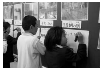
古市小学校 安全教育

各学校と連携し、通学路の安全点検を行い、対応検討を行う推進機関の設置を進めます。