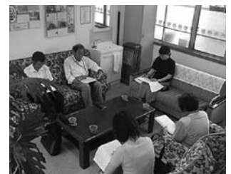
福住小学校 学校評議員会

コミュニティ・スクール推進校を指定し、保護者や地域住民で構成する学校地域運営協議会を組織し、ともに考え意見を出し合い、協働しながら子どもの豊かな成長を支える仕組みづくりに取り組みます。今後、市内全校でのコミュニティ・スクールの導入推進を図ります。