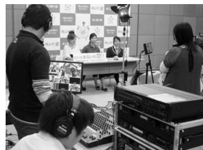
新しい情報発信「丹波篠山まるいのTV」

全国アマチュアビデオコンクールとして実施している「丹波篠山ビデオ大賞」では、「映像文化のコラボレーション」をキーワードとしたメッセージ性の高い教育事業となるよう、親しまれる大会運営に取り組みます。