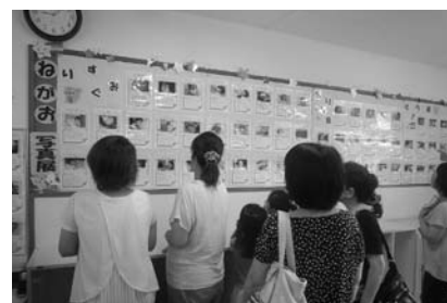
寝顔写真展(味間認定こども園)

乳幼児期の「眠育」「食育」「あそび」を総合的に推進するため、引き続き、「ふた葉プロジェクト～ぐっすり眠って、たのしく食べて、たっぷり遊ぼう～」の研究成果を広め、また、モデル園で実施した「寝顔写真展」の取組を全公立保育園・幼稚園へ拡大します。