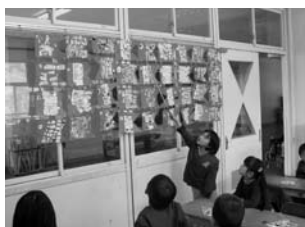
今田小学校 図工の作品紹介

効果的な少人数授業や小学校高学年での教科担任制など学習形態を工夫し、個に応じた学習指導を展開することにより確かな学力の定着を図ります。