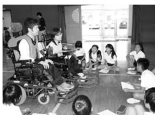
城南小学校 車椅子サッカー交流事業