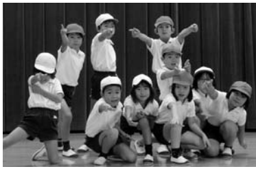
大山小学校 兵庫県ダンス発表研究大会

体力・運動能力調査によって子どもたちの実態と傾向を把握し、体力・運動能力の向上に向けて各学校で計画的・継続的に実践する取組を推進します。