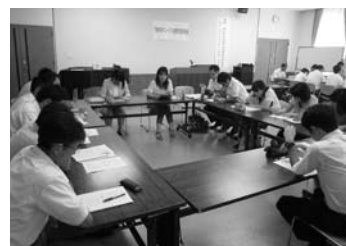
丹南中学校 小中連携事業

発達と学びの連続性を考え、小学校高学年における教科担任制や校種のつながりを考慮した授業研究や生徒指導体制の確立、中1ギャップ等の課題に対応する小中連携の実践的な研究を実施します。