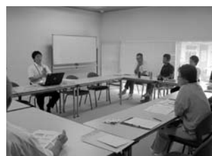
村雲小学校 外部講師による校内研修