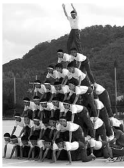
篠山東中学校 体育祭