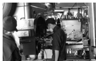
西紀中学校 トライやる・ウィーク