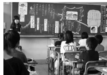
岡野小学校 国語の研究授業

学校の課題を明確化し、各学校の実情に応じた研究テーマを設定し、子どもたちの「生きる力」を育むため、各学校の主体的な研究を支援するとともに市内教職員の授業改善・指導力向上等に努めます。