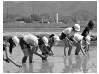
西紀南小学校 田植え体験