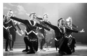
平成25年度の市民ミュージカル