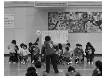
篠山養護学校 集会活動

特別な支援を必要とする子どもが、自己の能力や特性を最大限に発揮し、教育的ニーズに応じた個別の教育支援計画(サポートファイル)による一貫した支援のもと、将来の自立と社会参加に向けて一人一人の成長と発達をめざす教育を推進します。特別支援教育は、障がいがあり支援を必要としている子どもたちを支える教育であると同時に、周囲の子どもたちとともに伸びていく教育であるという視点に立った教育を推進します。