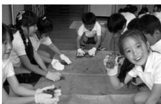
味間小学校 茶もみ体験

篠山市の自然環境を生かし、命の大切さや命のつながりを学ぶことに視点を置いた体験型環境学習を継続して実施します。体験活動を通じて子どもの社会性や人間性を育むため、小学5年生を対象に「自然学校」を実施します。また、「農都篠山」をフィールドとして、地域住民の講師に学んだり、市内高等学校との連携を深めたりしながら環境体験事業の充実に取り組みます。