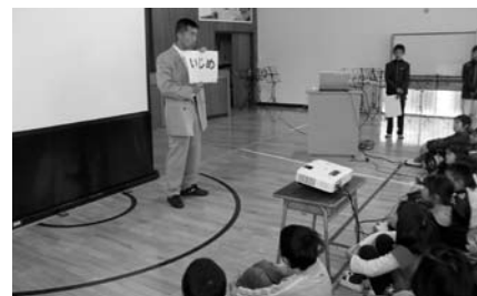
西紀北小学校 全校生での人権学習

「篠山市子どものいじめの防止等に関する条例」「篠山市子どものいじめの防止等に関する行動指針」「学校いじめ防止基本方針」に基づき、いじめ対応チームを中核として、組織的にいじめの未然防止・早期発見・早期対応に向けて取り組みます。