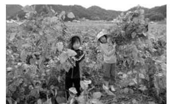
八上小学校 黒枝豆の収穫