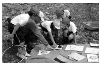
城北畑小学校 畑川水質調査