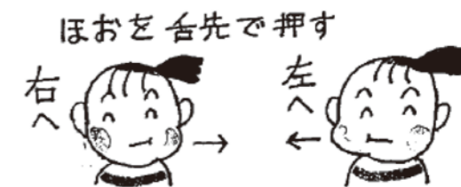
<丹波地域オリジナル お口の元気アップ体操>より抜粋