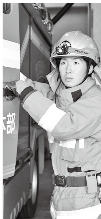
問い合わせ 総務課 ☎552・5113

第1次試験 とき 9月22日(日) 8時50分開始(8時30分から受け付け) ところ 丹波篠山市市民センター 内容 教養試験(事務職、消防職、建築・土木職)、体力試験(消防職、土木職) 第2次試験(第1次試験合格者に通知します) とき 10月20日(日)の予定 内容 論文試験、集団面接、実技試験(幼保職) 第3次試験(第2次試験合格者に通知します) とき 11月11日(月)の予定 内容 個人面接