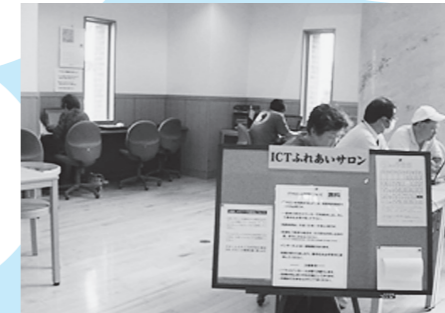
ICTふれあいサロン(中央図書館)