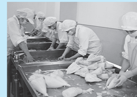
学校給食食材の洗浄(篠山東部学校給食センター)