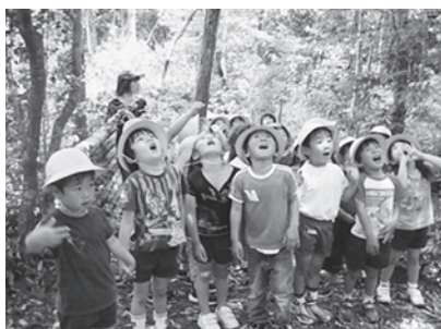
篠山チルドレンズミュージアムで里山探検(八上幼稚園)