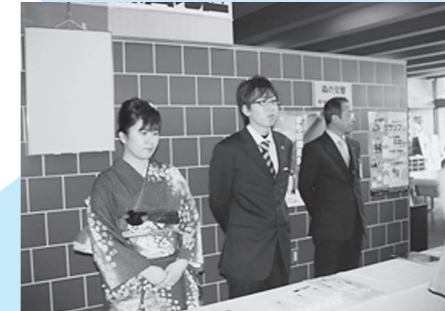
成人式(田園交響ホール)

成人有志の皆さんによる実行委員会を組織し、手作りで心のこもった企画立案を工夫します。