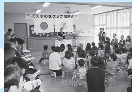
預かり保育施設開所式(くすのきクラブ)