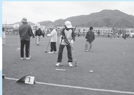
スポーツクラブのグラウンドゴルフ大会(篠山総合スポーツセンター)