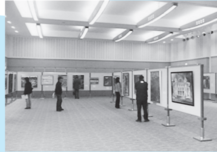
第4回篠山市展(篠山市民センター)