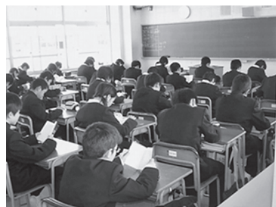
朝の読書タイム(丹南中学校)

篠山市教育委員会においては、教育理念「一人一人が光り輝き、生きがいをめざす」に基づき3つの教育目標を掲げ、その実現に向けて教育改革、学校教育、社会教育の3分野それぞれに重点課題を設定し、課題解決に取り組みます。