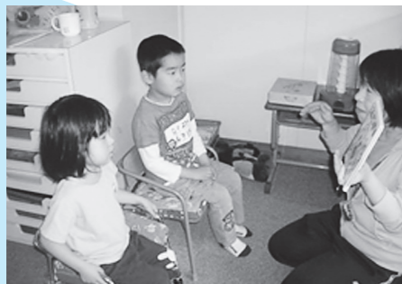
一人一人を大切に授業(篠山養護学校)