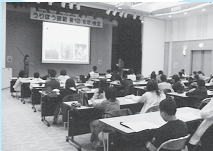
第1回「うりぼう師範検定」(篠山市民センター)