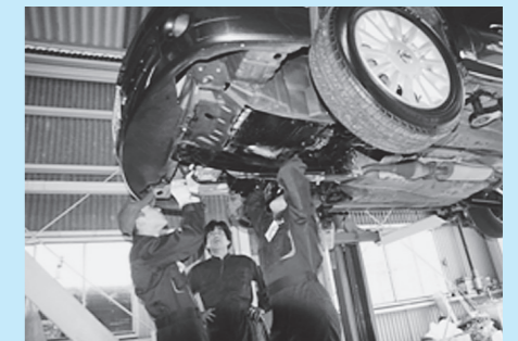
「トライやる・ウィーク」での自動車整備体験(西紀中学校)

発達段階に応じた性教育と薬物乱用防止教育の実施により、心身ともに豊かな育成をめざします。