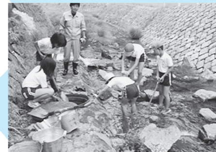
オオサンショウウオの人工巣穴そうじ(後川小学校)

小学3年生を対象に、地域の自然の中で、命の営みやつながり、大切さについて実感させ、自然環境を大切に思う心を育成します。