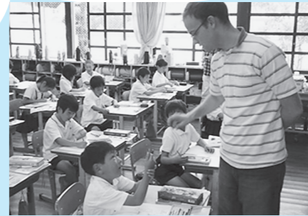
ALTと一緒に英語で遊ぼう(八上小学校)

今年度から全小学校で外国語(英語)活動を実施し、外国語指導助手(ALT)や外国語活動支援ボランティア(JTE)を活用した指導を推進します。