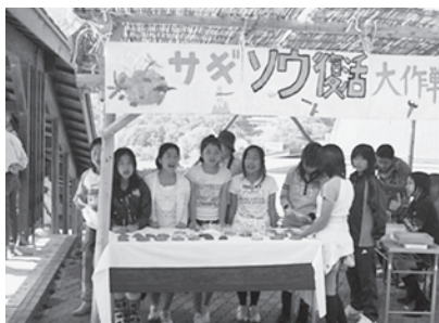
総合的な学習の時間におけるサギソウ保存活動(今田小学校)

篠山市教育委員会では、“子どもが楽しく学び、地域に信頼される学校づくり”と“学びの機会を充実し、誰もが学習の喜びを実感できるまちづくり”の実現を皆さんとともにめざします。