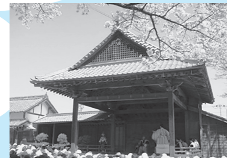
篠山春日能(春日神社能舞台)