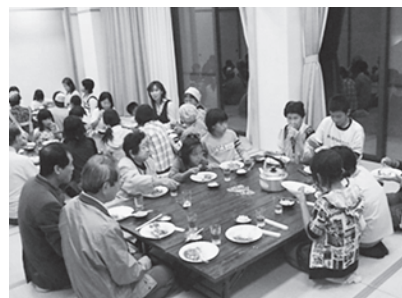
通学合宿(古市小学校区)