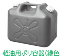
軽油用ポリ容器(緑色)