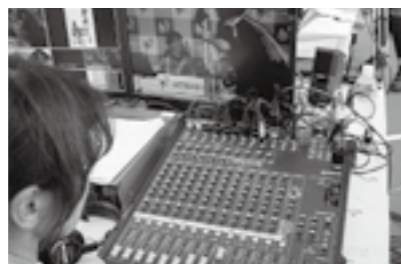
デカンショ祭ライブ中継

また、全国アマチュアビデオコンクールとして実施している「丹波篠山ビデオ大賞」が今年度で25回を数えます。節目となる記念大会とするとともに、丹波篠山の魅力発信・情報発信の場となるよう、これからの映像文化を考えていく教育事業となるよう、より親しまれるビデオ大賞づくりに取り組みます。