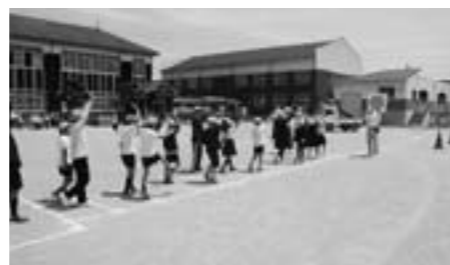
八上小学校 交通訓練