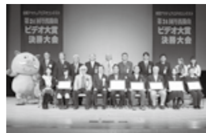
第24回丹波篠山ビデオ大賞決勝大会