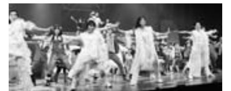
前回(平成23年度)の市民ミュージカル

子どもから大人まで誰もが楽しめる魅力ある公演を支援します。 【主催事業】・桂文珍ふるさと独演会・伍代夏子&三山ひろし演歌まつり・綾戸智恵コンサート・篠山で初めての「ベートーヴェン第九」公演ほか