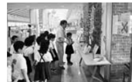
旧城北小学校 篠山市立中央図書館の見学

学校図書館を読書センター及び学習情報センターとして位置付け、蔵書冊数・蔵書内容の充実を図ります。また、学校図書館支援員を配置し、図書館教育を充実させ、子どもたちの言語能力の向上を図ります。