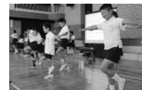
福住小学校 運動健康委員会による体力調べ

体力・運動能力調査によって子どもたちの実態と傾向を把握し、「一日の運動時間が30分以上の児童生徒の割合」を高めるとともに、体育の授業などで「運動プログラム」などを活用した体力・運動能力の向上を図ります。