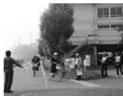
丹南中学校 地域挨拶運動