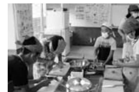
大山小学校 調理実習

食育の推進体制を整え、家庭や地域と連携した食育を進めます。また、保護者への一層の啓発を通して、子どもたちの望ましい食習慣の形成を図ります。