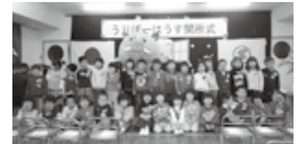
預かり保育「うりぼーはうす」開所式

小学校へのスムーズな移行をめざし、校園間等の交流を深め、連携を強化します。また、保育園と幼稚園の指導方法等の情報交換を行うなど連携を強化し、就学前教育の推進に取り組みます。