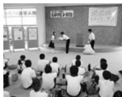
篠山東中学校 小中連携事業

センター内に設置する「ゆめハウス」で、不登校児童生徒の学校復帰と自己実現に向けた指導・支援を行います。