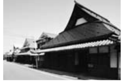
重要伝統的建造物群保存地区(福住地区)

篠山城跡及び八上城跡の整備、町並みの整備及び歴史文化施設の管理・運営を推進するとともに、篠山歴史文化基本構想に基づき、「歴史文化まちづくり資産」の一体的な保存と活用を図り、第40回記念篠山春日能の開催や脊椎動物化石の保護と活用など歴史文化遺産を活かしたまちづくりを推進します。