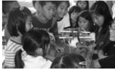
岡野小学校 モリアオガエルの観察

篠山市のすばらしい自然環境を生かし、命の大切さや命のつながりを学ぶことに視点を置いた体験型環境学習を継続して実施します。体験活動を通じて子どもの社会性や人間性を育むため、小学5年生を対象に「自然学校」を実施します。また、「農都篠山」をフィールドとして、特色ある農業教育を展開する篠山東雲高等学校や環境や里山文化の発信に取り組んでいる篠山産業高等学校丹南校との連携した体験学習についても取り組みます。