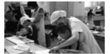
かぞくdeおいしんぼクッキング

公民館事業を中心に、市民の学習ニーズを把握しながら、芸術や文化・スポーツ活動を展開します。施設整備については、今年度、スポーツセンターの耐震補強工事を行います。また、「であい・ふれあい・まなびあい」をテーマに高齢者大学の充実を図り、高齢者一人一人の生きがいを支援します。