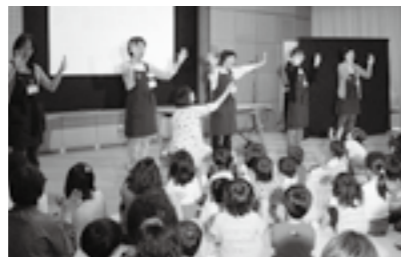
「とにかく楽しみ図書館へ行こう」イベント

平成24年度に作成した「図書館ビジョン」に基づき、各世代に応じた図書館事業を展開するとともに、生涯学習に活用される多様な蔵書の整備と充実を行います。さらに、子どもの読書活動を積極的に進めるほか、企画展や講演会の開催、郷土資料等の電子書籍化と修理・保存、障がい者サービスの充実などにも取り組みます。また、市民センター図書コーナーについては、引き続き市民ボランティアの協力を得て運営します。