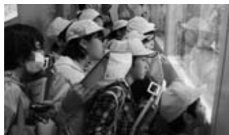
西紀小学校 消防署見学