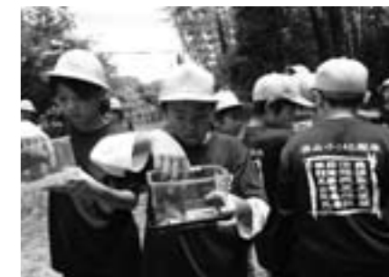
篠山小学校 オオムラサキ放蝶会

子どもたちに学力や読書習慣等を育む「学習タイム・読書タイム」を朝の時間など週時程表に位置づけて実施します。また、学校支援ボランティアなどによる読み聞かせにより、学校・家庭・地域の連携を図ります。