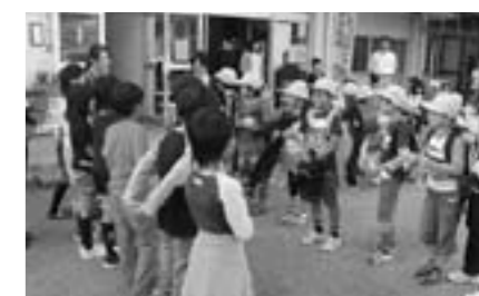
西紀北小学校 小規模校交流

様々な教育課題に適切に対応するため、教職員の資質の向上をめざした研修会などを実施します。また、校内研修や先進校の公開授業等に積極的に参加し、実践的な指導力を高めます。