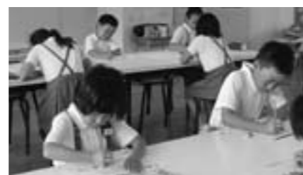
村雲小学校 漢字検定

学力向上プロジェクトチームによる全国学力・学習状況調査結果の分析と検証を行い、学力向上策について提案します。また、学力向上研修会を実施し、指導内容・指導方法の工夫・改善に努めます。