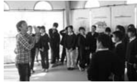
味間小学校 太古の生きもの館の見学