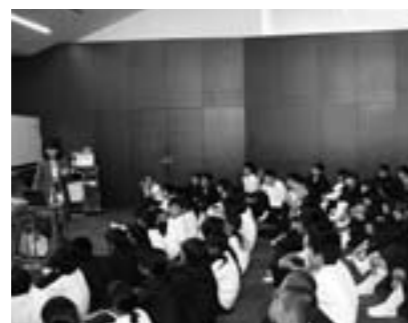
篠山中学校 外部講師による道徳の授業

教育課程(学び)の連続性を考え、小学校高学年における教科担任制や校種のつながりを考慮した授業研究や生徒指導体制の確立、中1ギャップ等の課題に対応する小中連携の実践的な研究を実施します。