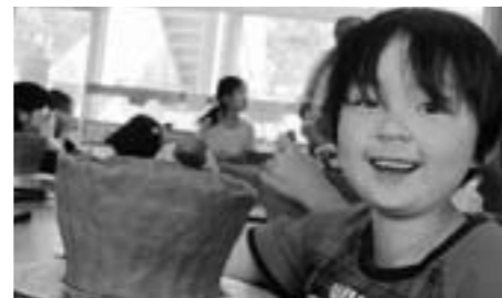
今田小学校 丹波焼作陶活動