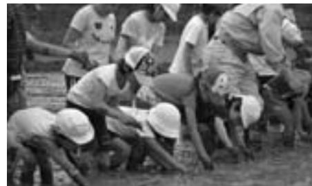
城東小学校 田植え