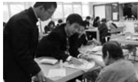
西紀中学校 生徒会によるボランティア活動