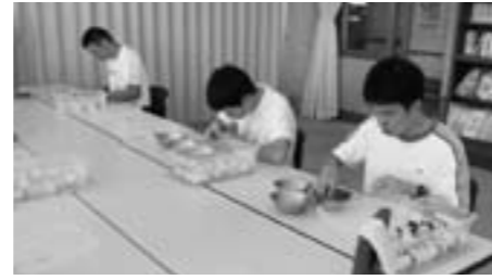
篠山養護学校 作業実習

特別な支援を必要とする子どもが、自己の能力や特性を最大限に発揮し、将来の自立と社会参加に向けて一人一人の成長と発達をめざす教育を推進します。また、特別支援教育は、障がいがあり支援を必要としている子どもたちを支える教育であると同時に、周囲の子どもたちとともに伸びていく教育であるという視点に立った教育を推進します。