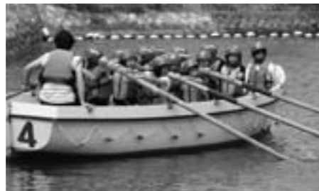
城南小学校 自然学校