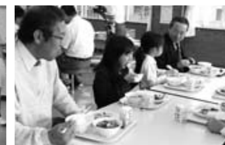
旧畑小学校 篠山まるごと井給食試食会