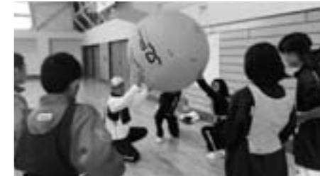
ニュースポーツ体験(スポーツ推進委員会)

市民誰もがスポーツを楽しむ環境づくりとして、スポーツ推進委員活動の推進や篠山市体育協会への支援、さらにはスポーツクラブ21の活性化に取り組みます。篠山市発のニュースポーツ「桶ツト卓球」をこんだ薬師温泉「ぬくもりの郷」と連携しながら普及に継続して取り組みます。