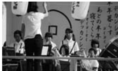
大芋小学校 金管バンドやぐら演奏