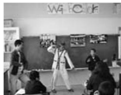
西紀南小学校 外国人青年との国際交流