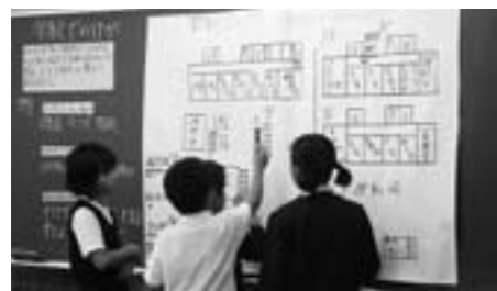
古市小学校 安全教育

各学校で年間指導計画に基づく防災教育を進め、防災についての理解を深めるとともに、火災・水害・地震等を想定した防災訓練を強化し、災害から身を守るための能力を高めます。