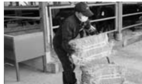
今田中学校 トライやる・ウィーク