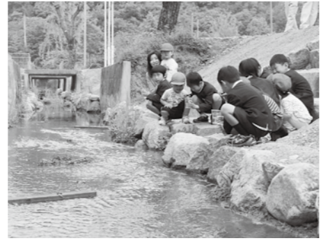
コンクリート三面張りの水路を多自然型の護岸に改修(ふるさとの川づくり)

味間地区では子どもの数が増えており、本年7月4日から、味間認定こども園がスタートしました。篠山産木材の活用、園庭の芝生化、安全な