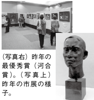
(写真右) 昨年の最優秀賞(河合賞)。(写真上) 昨年の市展の様子。

賞 ○最優秀賞(河合賞)1点(一般部門の第1席から1点のみ選出) ※副賞30万円。 ○市展賞(最優秀賞を除く)一般