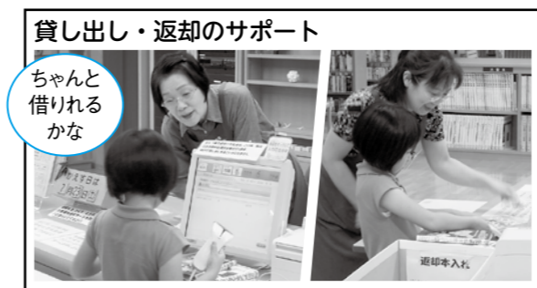
貸し出し・返却のサポート

業、入館者数の記録や新聞の整理作業など 活動時間 ①10時～14時(日曜日は13時30分まで)2人体制 ②14時～18時(日曜日は13時30分～17時)2人体制 ※希望に添って日程を調整します。自分の空いた時間にお手伝いください。 申し込み方法 右記まで電話