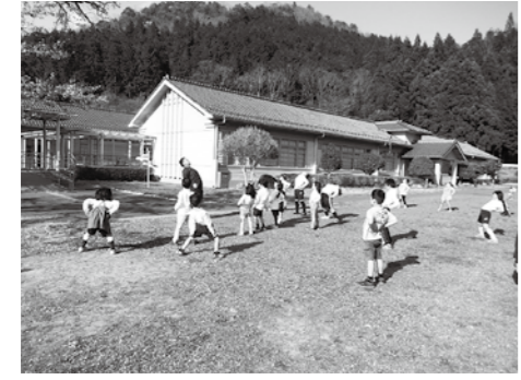
放課後の児童の遊びや生活の場を提供する児童クラブ(ちるみゆー)

一定の所得要件のもと、中学3年生までの子ども医療費の無料化を続けています。また、兄弟がいる場合、4・5歳児を対象に保育料、